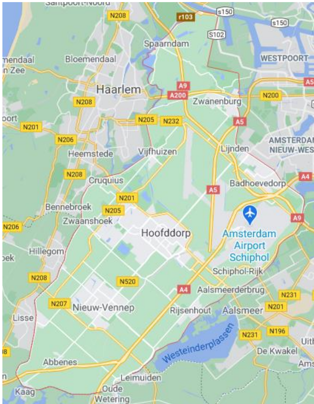
Figuur 1: Gemeente Haarlemmermeer

Dit BLVC is bedoeld voor werkzaamheden die maximaal één werkdag duren en waarbij niet de volledige rijbaan/weg afgezet wordt. Doel is om met beperkte inspanning een compleet BLVC te hebben voor kleine werkzaamheden. Het is van toepassing op alle werkzaamheden die verderop nog beschreven worden en die uitgevoerd worden in de gemeente Haarlemmermeer.